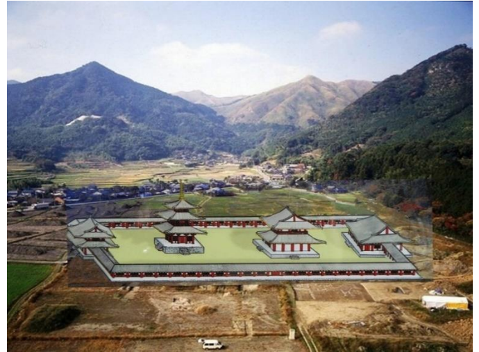
行橋市椿市にあったお寺のイメージ

地名は人の移動とともに移るものですから、近畿と豊前に同じ地名がありますが、記紀の地名と配置が合致する場所は豊前であって奈良県ではない、すなわち、ヤマト王朝は田川に興ったと福永氏は述べています。